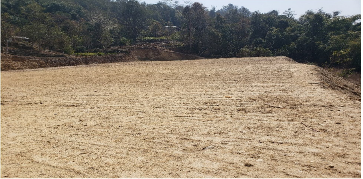
निर्माणाधिन नाइखोल्याड खेलमैदान