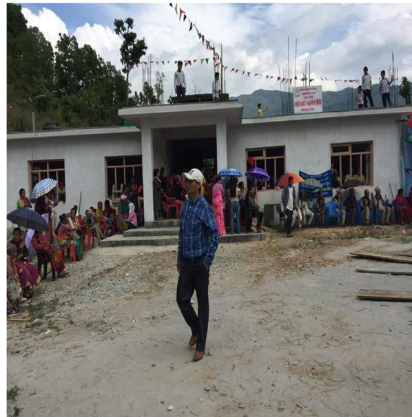
चाक्सिबोटे स्वास्थ्य चौकीभवनको उदघाटन