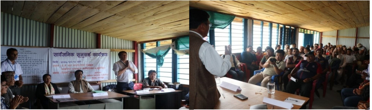
योजना कार्यान्वयनमा जन हभागिताका सफल अभ्यासहरु- सार्वजन सुनुवाई