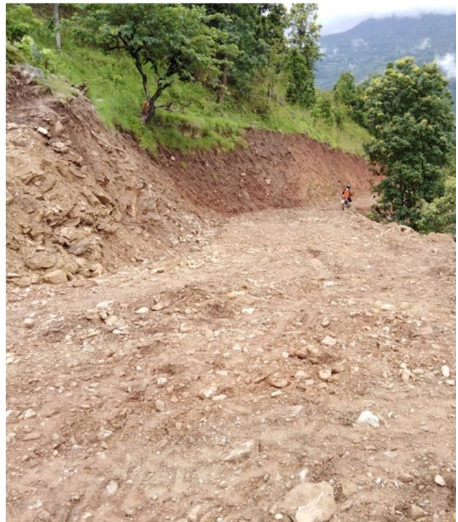
खोक्से कामीडाँडा थेचम्बु खाल्टे चाक्सिबोटे थुम्बेदिन सडक (थेचम्बु खण्ड)