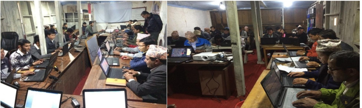
२२ दिवसीय कम्प्युटर सिप विकास तालिम