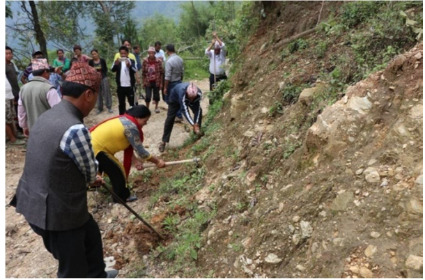
खोक्से कामीडाँडा थेचम्बु खाल्टे चाक्सिबोटे थुम्बेदिन सडक (चाक्सिबोटे खण्ड)